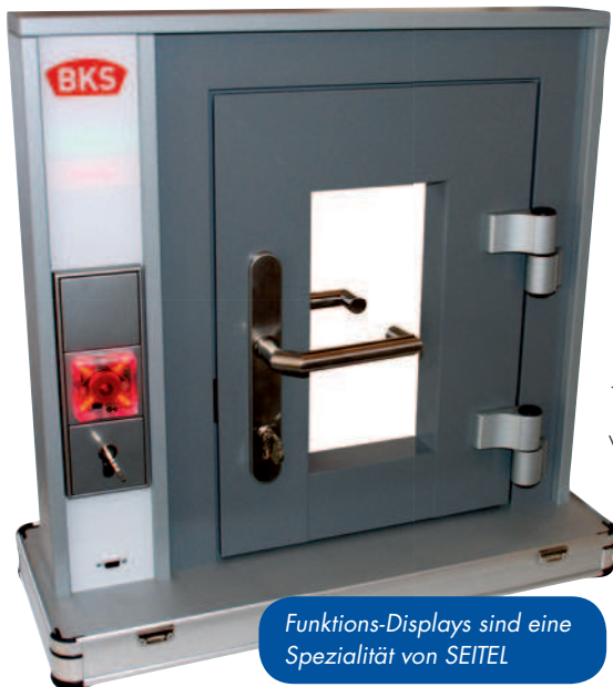
Funktions-Displays sind eine Spezialität von SEITEL