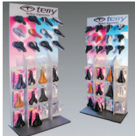
SEITEL-Kreation für den Fahrrad-Hersteller terry