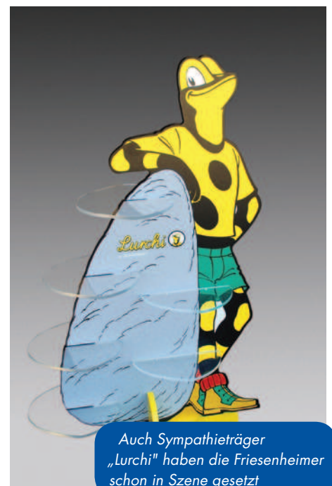
Auch Sympathieträger „Lurchi“ haben die Friesenheimer schon in Szene gesetzt

Eine Global Player aus dem Schwarzwald bedient sich eines von den Badensern gefertigten Präsentationsmodells, das ausschließlich für den Fachhändler bestimmt ist. Der Endkunde kann Wasserläufe verfolgen und die Funktion am Originalteil eigenhändig überprüfen. SEITEL obliegt darüber hinaus die komplette Installation inklusive der elektronischen Montage. „Besonders bei diesem letzten Schritt sind einige Dinge zu beachten, um den weltweit unterschiedli-