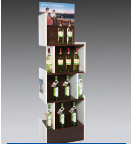
Weinspezialitäten: Ansprechend und zeitgemäß präsentiert

chen Gegebenheiten gerecht werden zu können“, bekennt Erwin Seitel. Für die Traditionsmarke Hansgrohe kreierte SEITEL ein Funktionsmuster für einen Duschkopf, bei dem auf Knopfdruck Stärke und Art des Wasserstrahls eingestellt werden können. Welche Einstellung vorgenommen wurde, lässt sich auf einem integrierten Bildschirm nachvollziehen. Auch hier musste man den Anforderungen eines Global Players gerecht werden, denn auch diese Displays sind mit elektronischen Steuerelementen ausgestattet, die ihrerseits weltweit funktionieren müssen. Um die Prä-